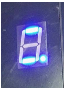
正常状態 (写真 2)