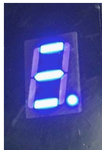
エラー状態 (写真 3)